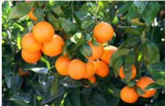
CITRUS X SINENSIS Naranja