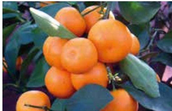
CITRUS FURTUNELLA X MITIS Calamondín