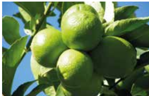
CITRUS X LATIFOLIA Lima