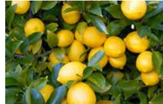
CITRUS X LIMÓN Limonero